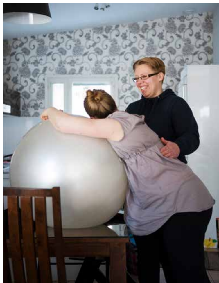
Doula-suhde alkaa yleensä 30 raskausviikon tietämillä. Doula tukee perhettä tarjoten heille tietoa synnytyksen fysiologisesta kulusta sekä siitä, miten äiti ja kumppani voivat tarjota hyvät lähtökohdat synnytyksen luonnolliselle kululle. Doulan voi palkata myös vain synnytykseen, jolloin doula tulee suoraan sairaalaan ja on siellä synnyttäjän tukena.